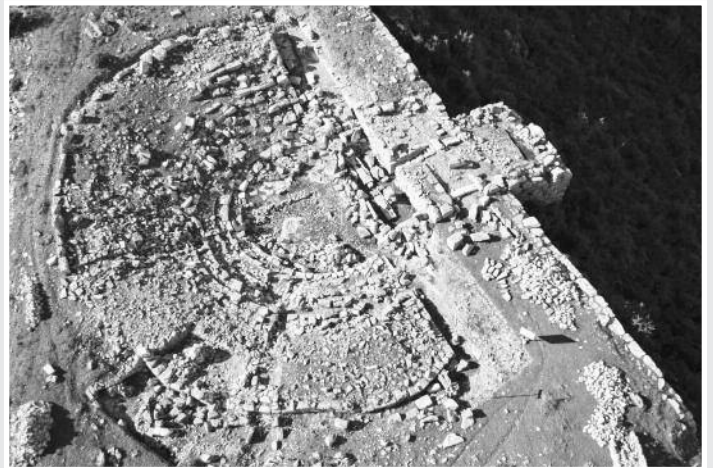
Το Αρχαίο Θέατρο Πλατιάνας

Περπατήσαμε από την Ακρόπολη έως την Κεντρική Πύλη απολαμβάνοντας την ομορφιά του μοναδικού αυτού τοπίου και ύστερα μας περιμέ-