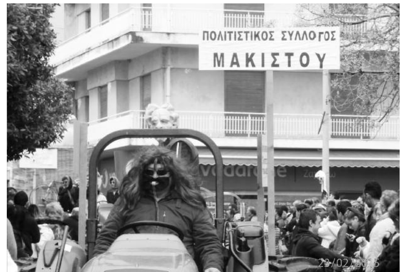
Το άρμα της Μακίστου με θέμα «Ο Οινολόγος»

Για άλλη μια φορά αποδείχθη ότι όταν όλοι οι Σύλλογοι συμμετέχουν ενεργά η επιτυχία είναι βέβαιη.